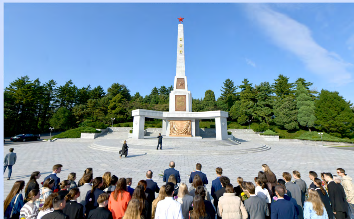
俄罗斯青年友好参观团前往解放塔敬献鲜花

以俄罗斯青少年联合国国家理事会副主席为团长的俄罗斯青年友好参观团于10月17日至24日前来访问我国。