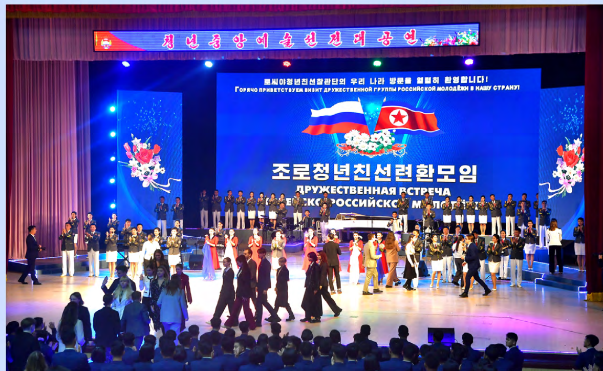
朝俄青年友好联欢会举行