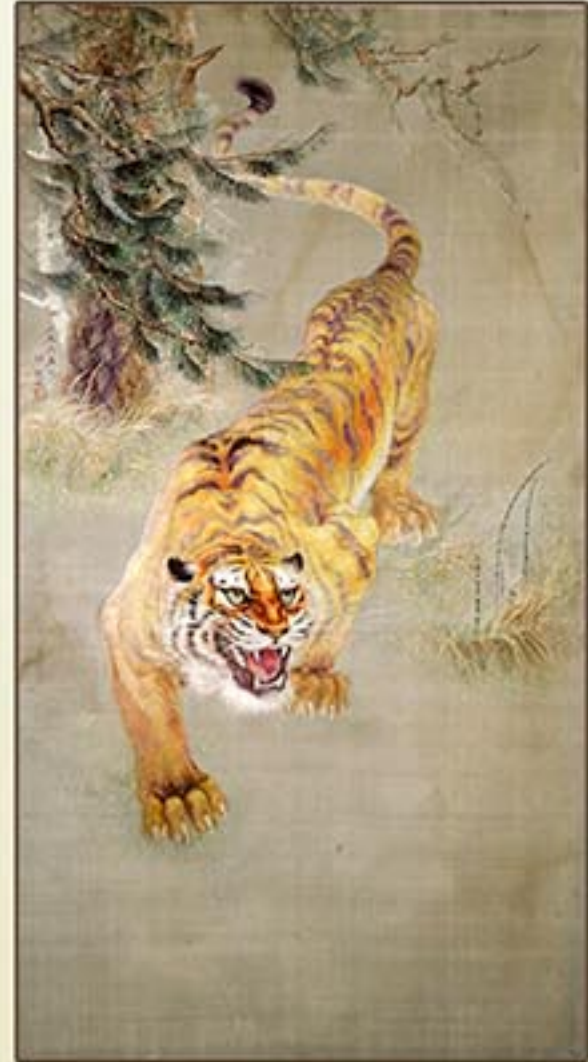
수예 《호랑이》 리원인 1965년 Embroidery "Tiger" by Ri Won In, 1965