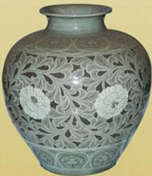
도자공예 《목단장식청자꽃병》 우치선 1995년 Ceramic "Celadon Vase with Peony Patterns" by U Chi Son, 1995