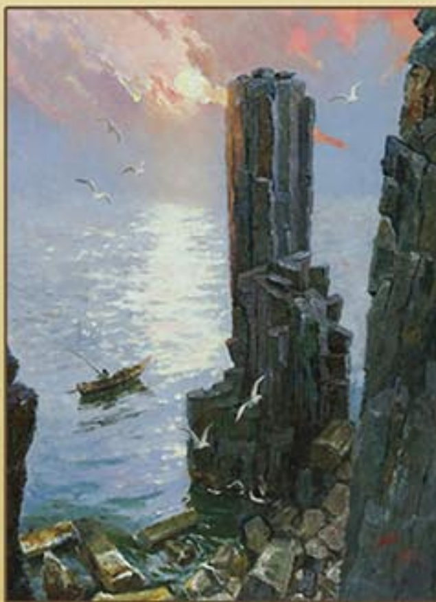
유화 《홍석정의 해돋이》 홍성철 1988년 Oil painting "Chongsokjong at Sunrise" by Hong Song Chol, 1988