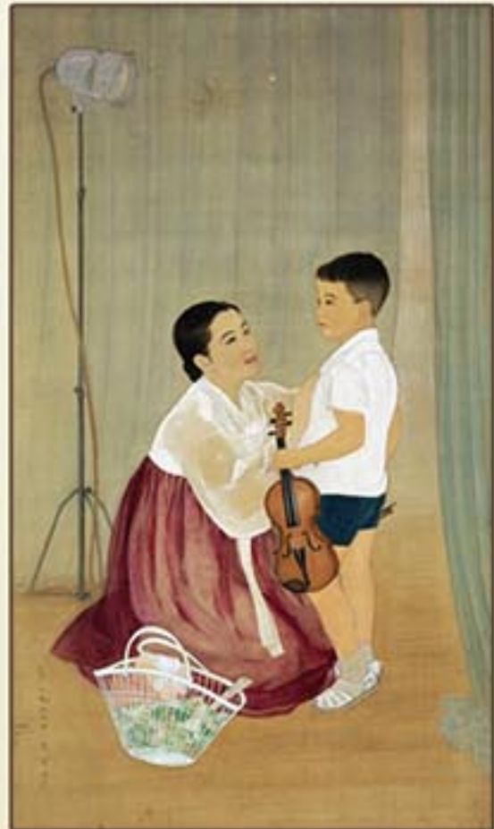
조선화 《부탁》 강정님 1966년 Korean painting "Request" by Kang Jong Nim, 1966