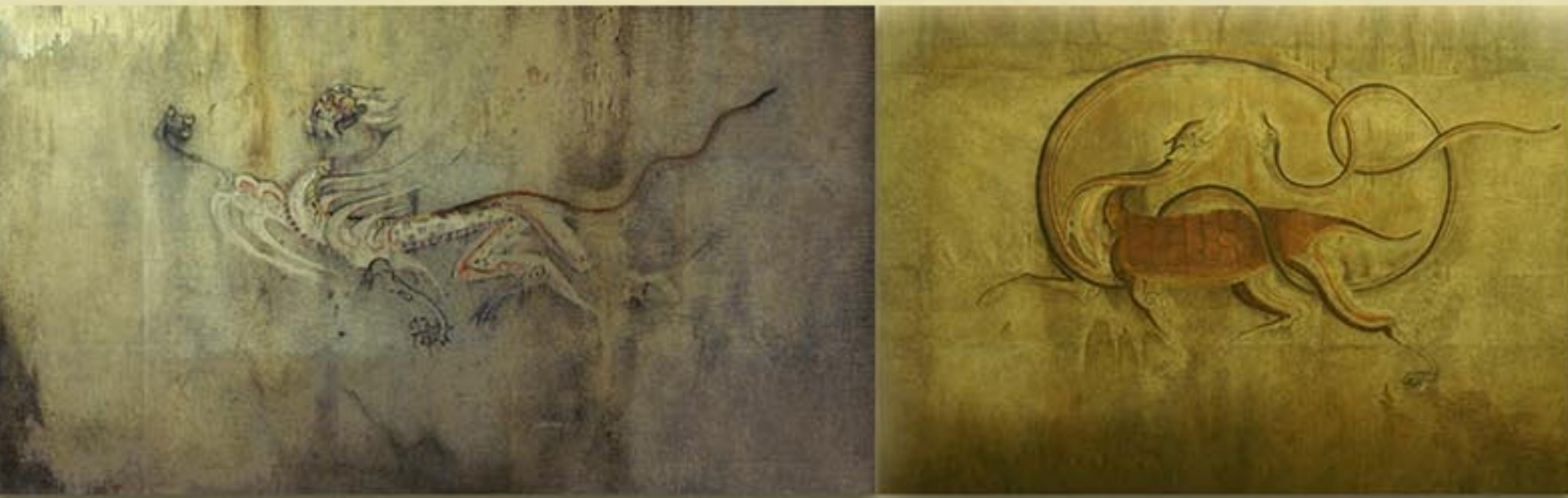
강서중무덤벽화 《백호》 7세기 중엽 “White Tiger” detail from a mural in the medium-size tomb of the Three Kangso Tombs, mid-7th century