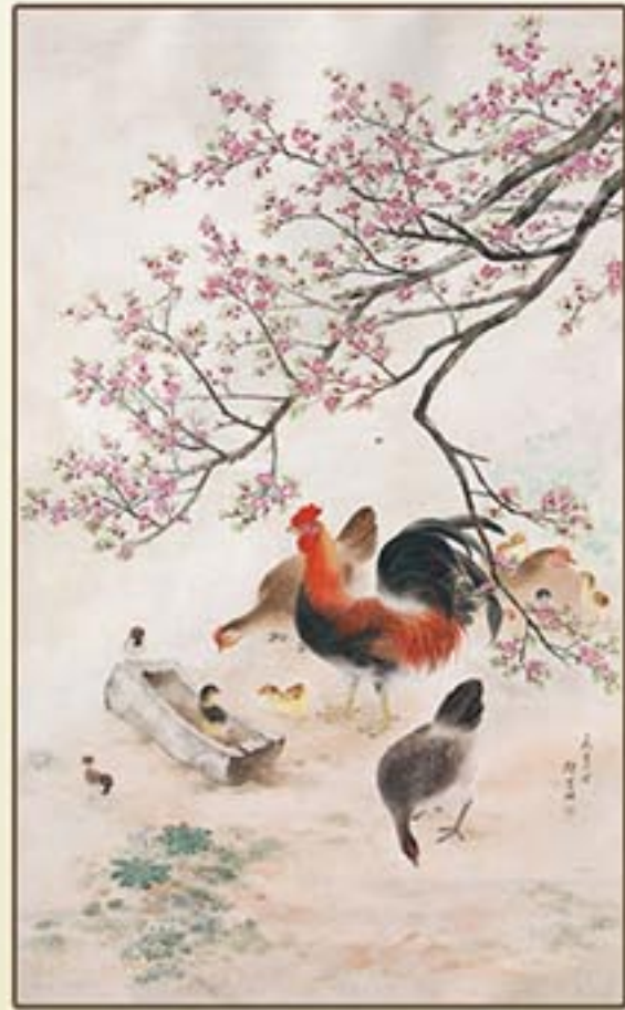
조선화 《5월의 농촌》 정종여 1956년 Korean painting "A Fam Village in May" by Jong Jong Yo, 1956