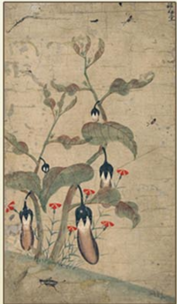
《가지》 신사임당 1504-1551 “Eggplant” by Sin Saimdang, 1504-1551