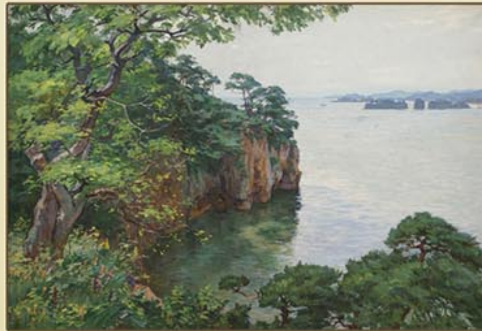
유화 《홍원풍경》 정관철 1964년 Oil painting "Landscape of Hongwon" by Jong Kwan Chol, 1964