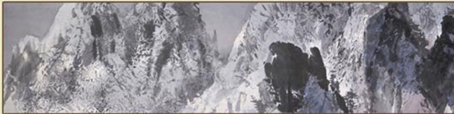
조선화 《설악만봉》 정창모 1992년 Korean painting "Snow-covered Mountain Peaks" by Jong Chang Mo, 1992