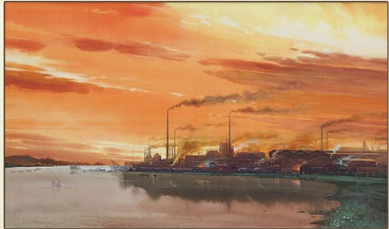
조선화 《강선의 저녁노을》 정영만 1973년 Korean painting "Evening Glow over Kangson" by Jong Yong Man, 1973