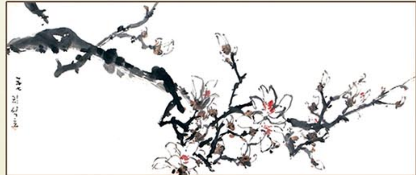
조선화 《목련》 리석호 1957년 Korean painting "Magnolia" by Ri Sok Ho, 1957