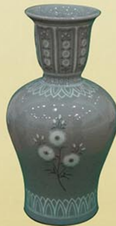
도자공예 《국화무늬박이꽃병》 임사준 1991년 Ceramic "Vase Inlaid with Chrysanthemum Design" by Im Sa Jun, 1991