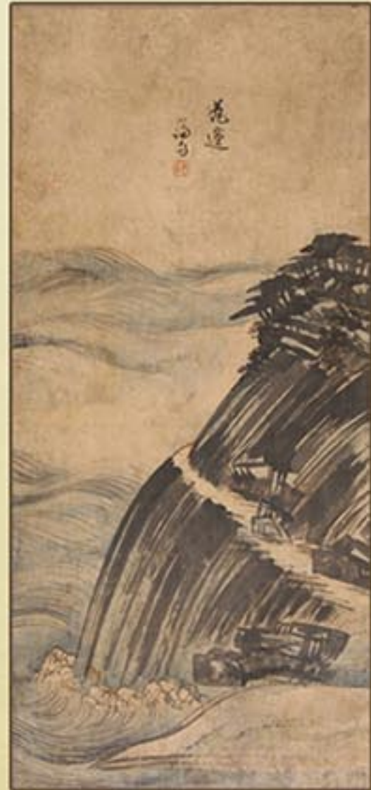
《옹천의 파도》 정선 1676-1759 “Waves at Ongchon” by Jong Son, 1676-1759