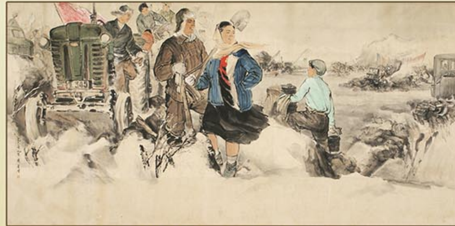
조선화 《간석지개간》 리률선 1961년 Korean painting "Tideland Reclamation" by Ri Ryul Son, 1961