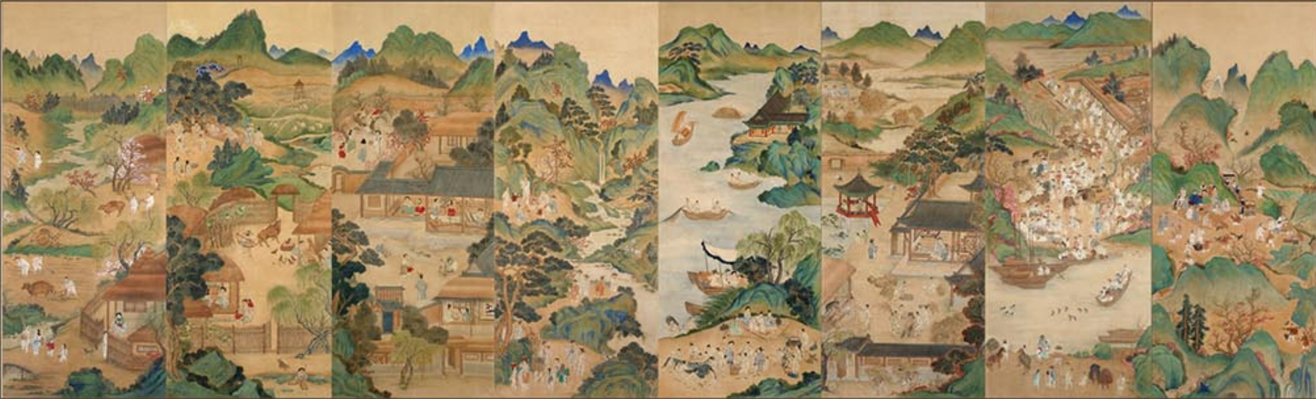
《농민생활도》 18세기 “Picture of the Country Life”, 18th century