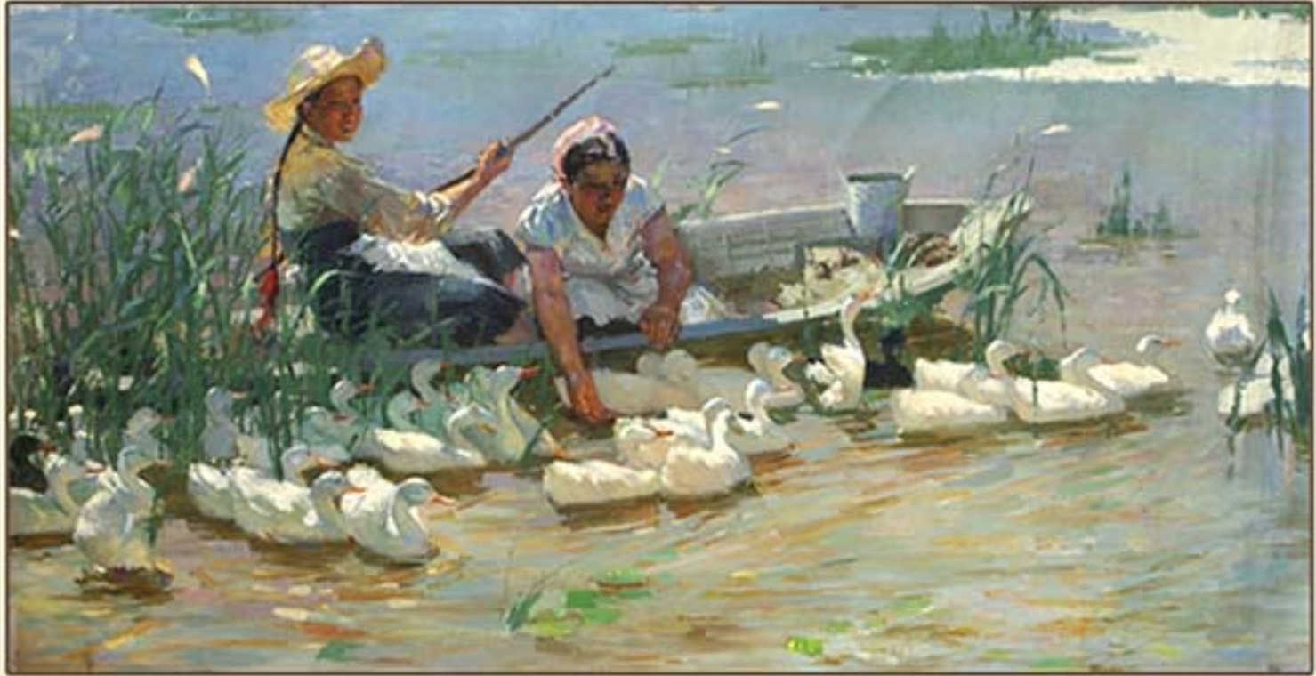
유화 《사랑》 리동희 1961년 Oil painting "With Affection" by Ri Tong Hui, 1961