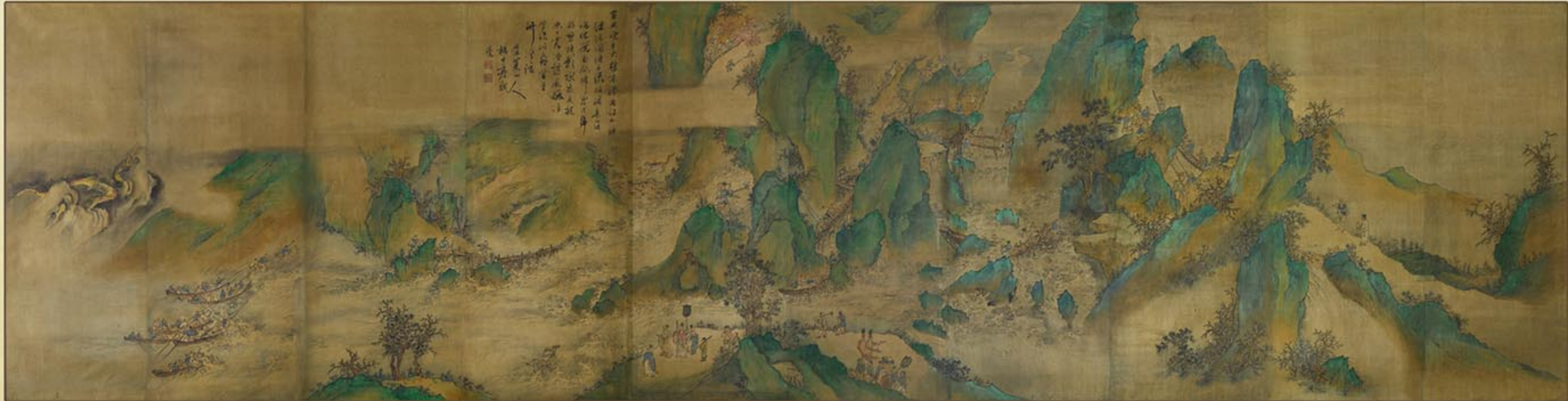
《산과 물을 다스리다》 16세기 “Conservation of Rivers and Forests”, 16th century