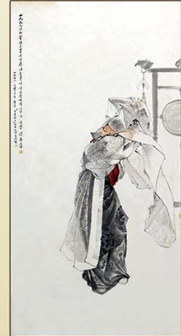
조선화 《춤》 김용준 1958년 Korean painting "Dancing" by Kim Yong Jun, 1958