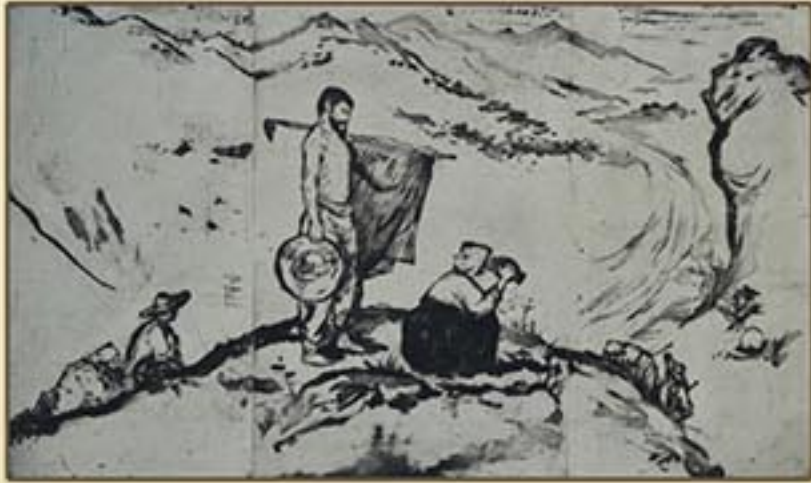
판화 《화전민》 함창연 1959년 Print "Slash-and-burn Peasants" by Ham Chang Yon, 1959