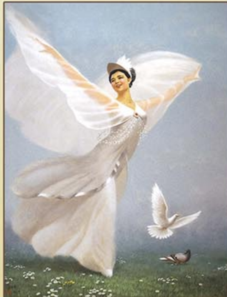
조선보석화 《비둘기춤》 신봉화 1992년 Korean Jewel painting "Dove Dance" by Sin Pong Hwa, 1992