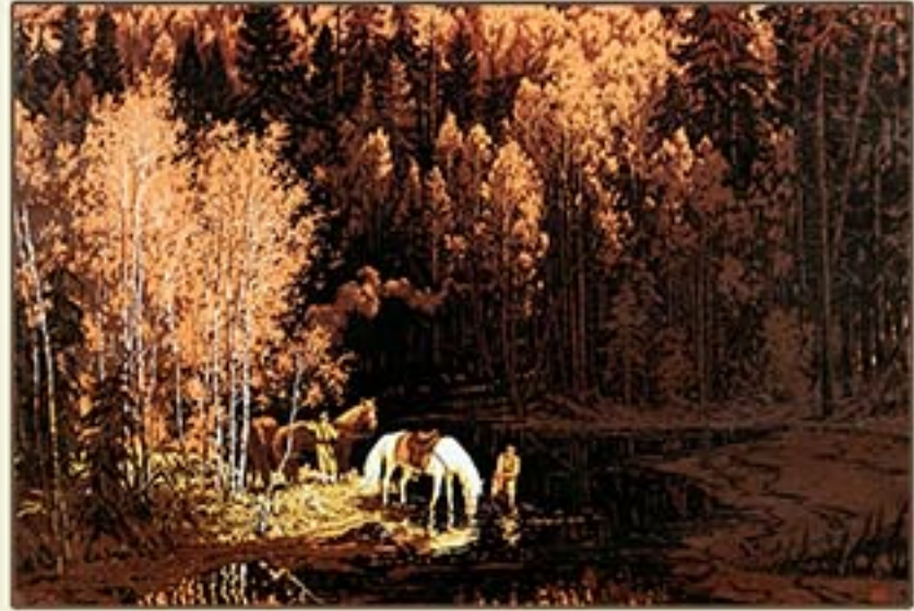
판화 《백마》 엄광수 1996년 Print "White Horse" by Om Kwang Su, 1996