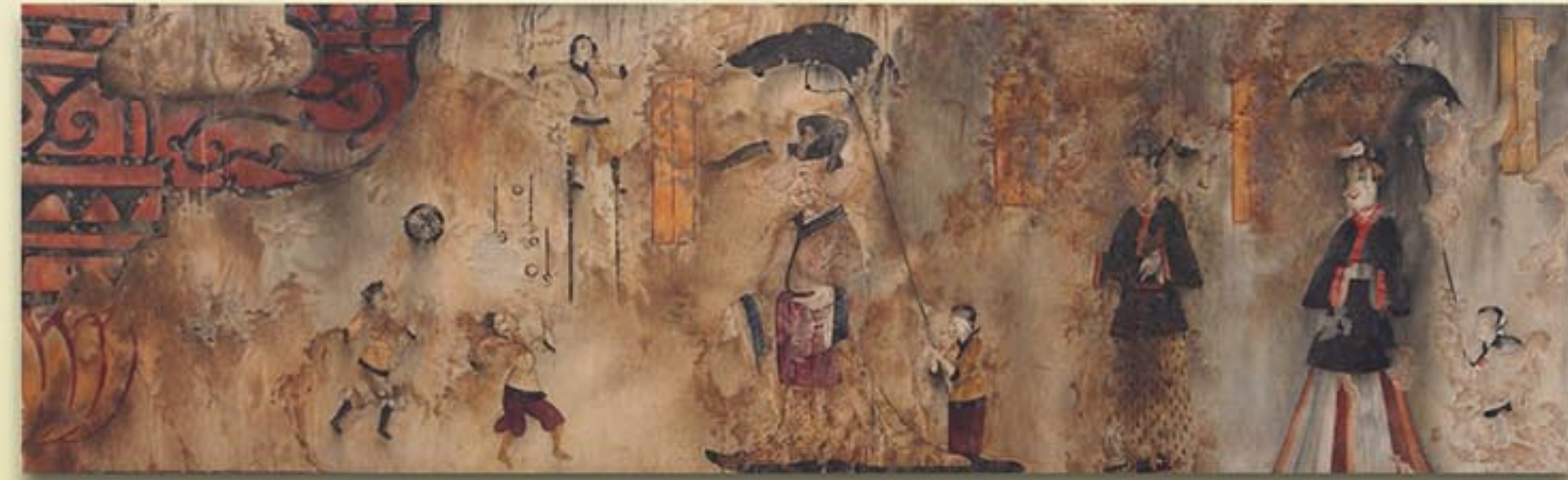
수산리무덤벽화 《주인공과 광대》 5세기 후반기 “Master and Clown” detail from a mural in Susanri Tomb, latter half of the 5th century