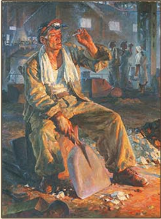
유화 《실참에》 송찬형 1958년 Oil painting "At a Break" by Song Chan Hyong, 1958