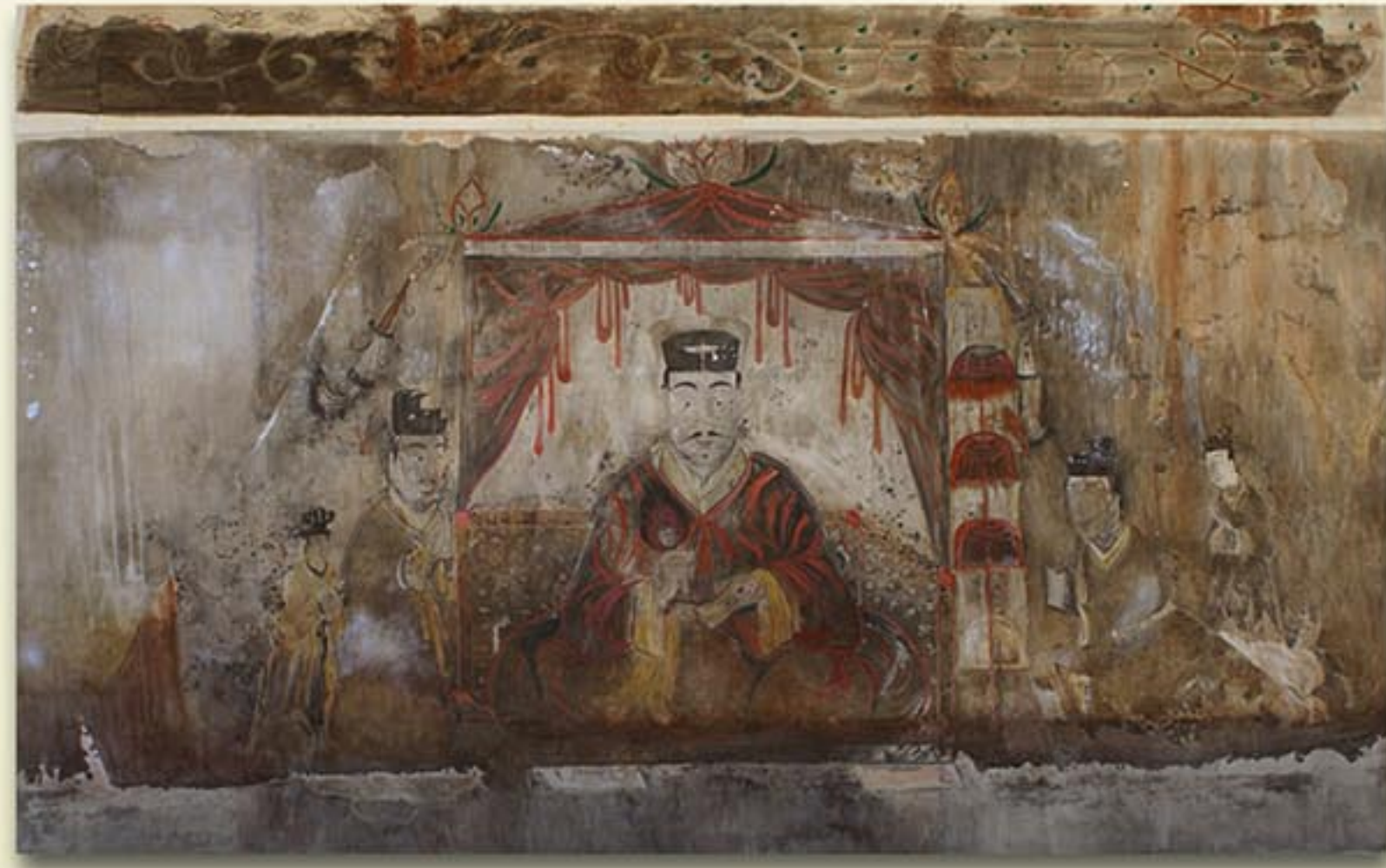
안악제3호무덤벽화 《남주인공》 4세기 중엽 “Hero” detail from a mural in Anak Tomb No. 3, mid-4th century