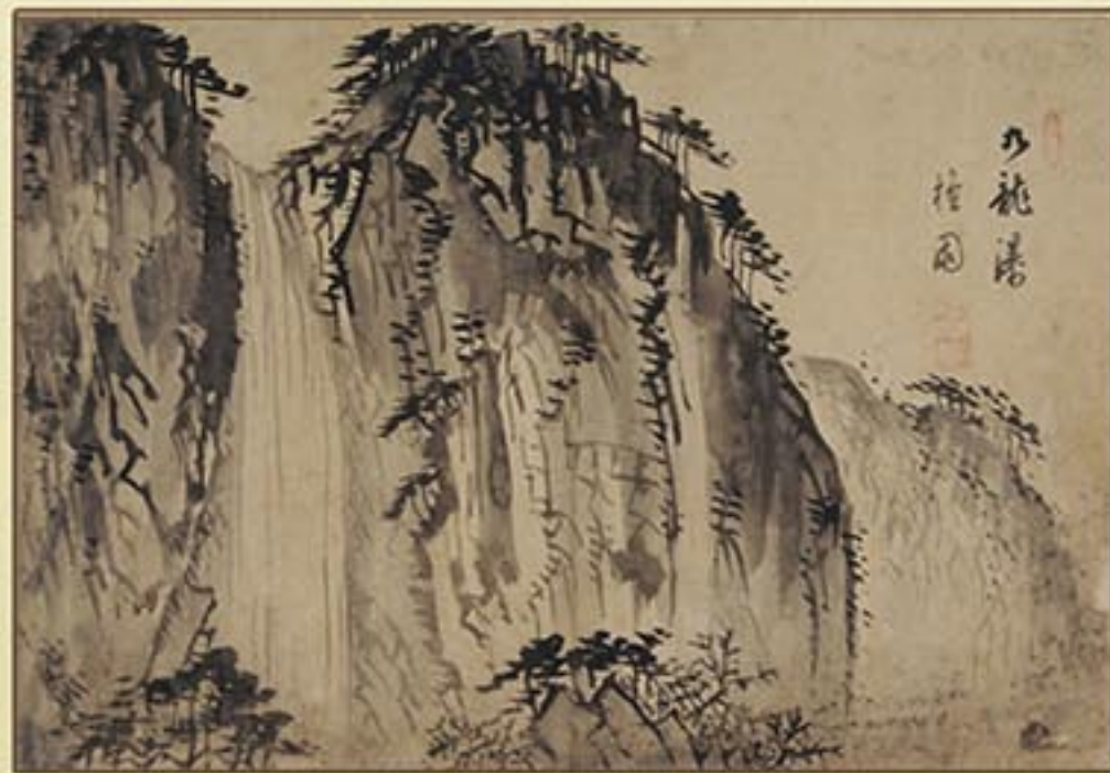
《구룡폭》 김홍도 1745-1816 “Kuryong Falls” by Kim Hong Do, 1745-1816