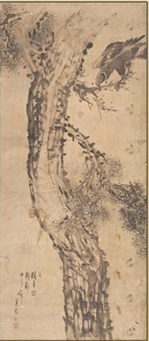
《소나무와 매》 신윤복 1758-? “Hawk on a Pine Tree” by Sin Yun Bok, 1758-?