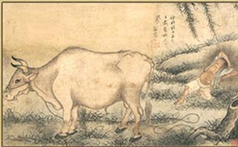
《소몰이군》 김두량 1696-1763 “Cowherd” by Kim Tu Ryang, 1696-1763