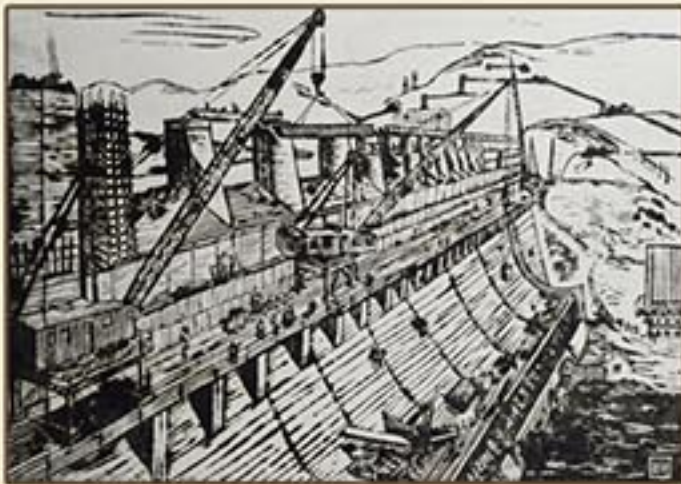
판화 《장자강발전소》 배운성 1959년 Print "Jangjagang Power Plant" by Pae Un Song, 1959