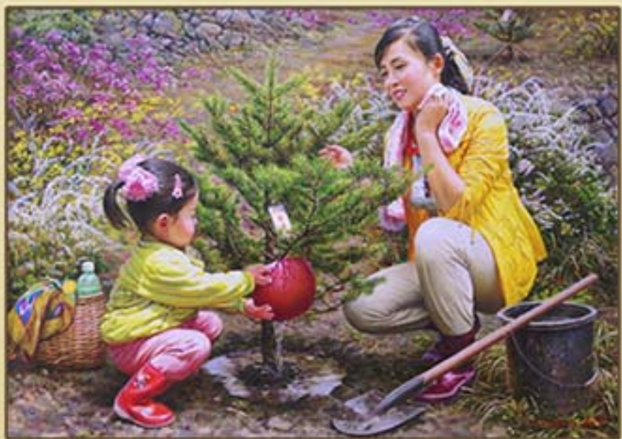
유화 《애국의 마음》 최문혁 2015년 Oil painting "Patriotic Mind" by Choe Mun Hyok, 2015