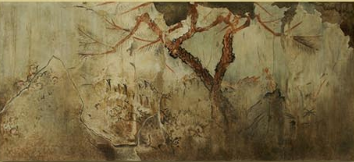
왕건왕릉벽화 《소나무와 매화, 백호》 10세기 “Pine Tree, Apricot Blossoms and White Tiger” detail from a mural in the Mausoleum of King Wang Kon, 10th century