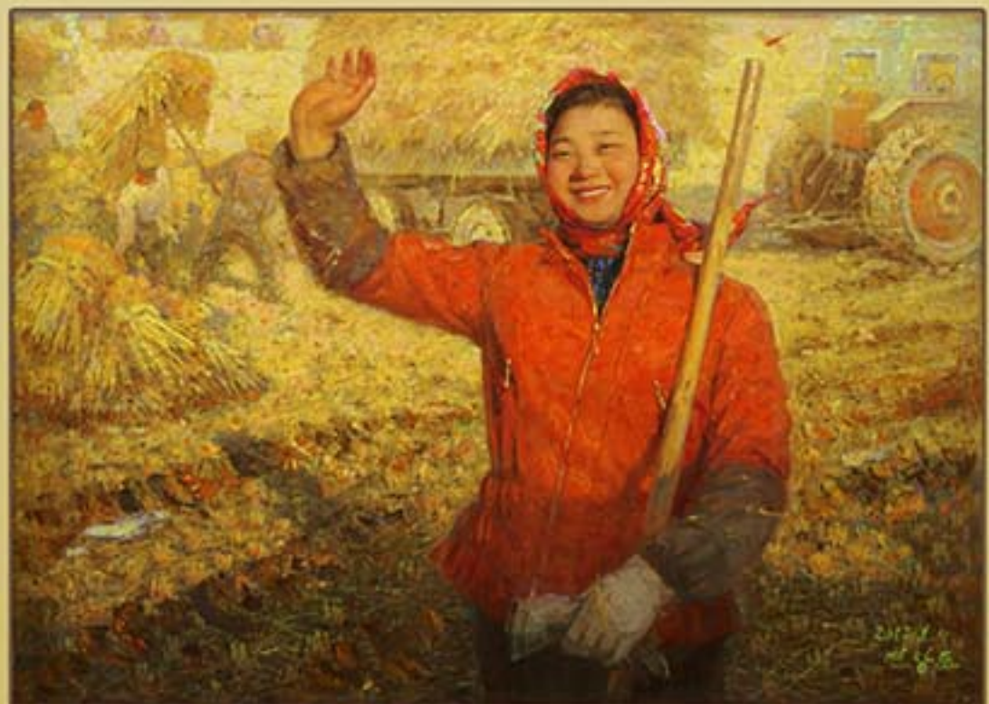
유화 《농장원처녀》 변창윤 2012년 Oil painting "Lady Farmer" by Pyon Chang Yun, 2012