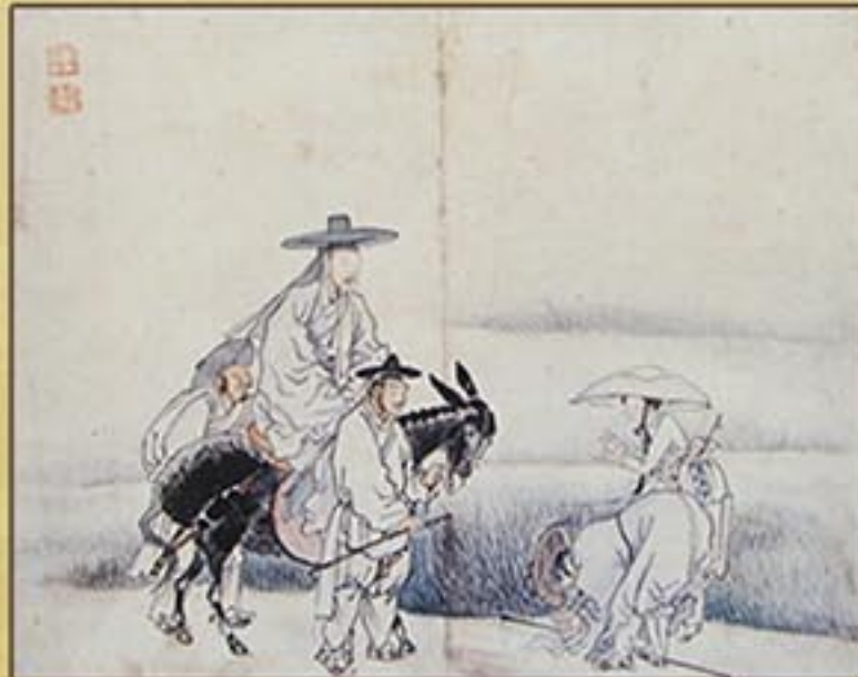
《량반과 농민》 김득신 1754-1822 “Nobleman and Peasants” by Kim Tuk Sin, 1754-1822