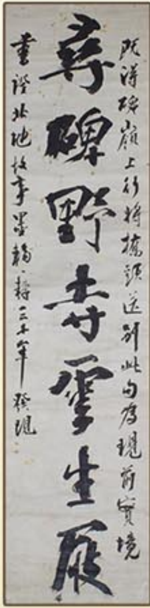
《옛 비석을 찾아》 김정희 1786-1856 “In Search of Old Gravestone” by Kim Jong Hui, 1786-1856