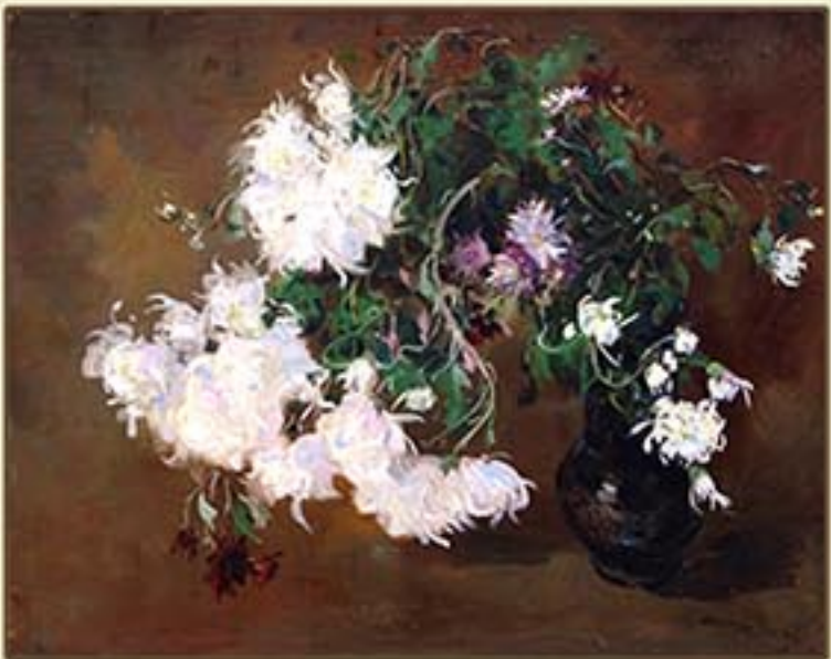
유화 《국화》 한상익 1985년 Oil painting "Chrysanthemum" by Han Sang Ik, 1985