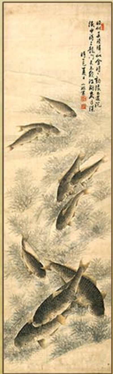
《잉어》 조석진 1917년 “Carps” by Jo Sok Jin, 1917