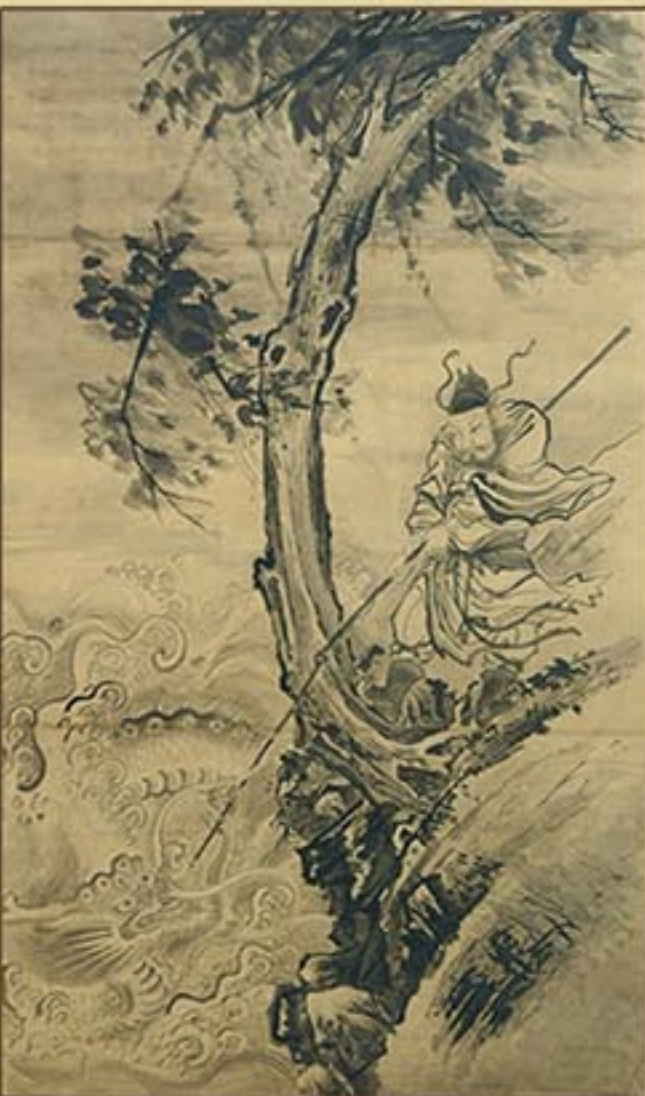
《룡을 낚는 사람》 17세기 “Dragon Angler”, 17th century