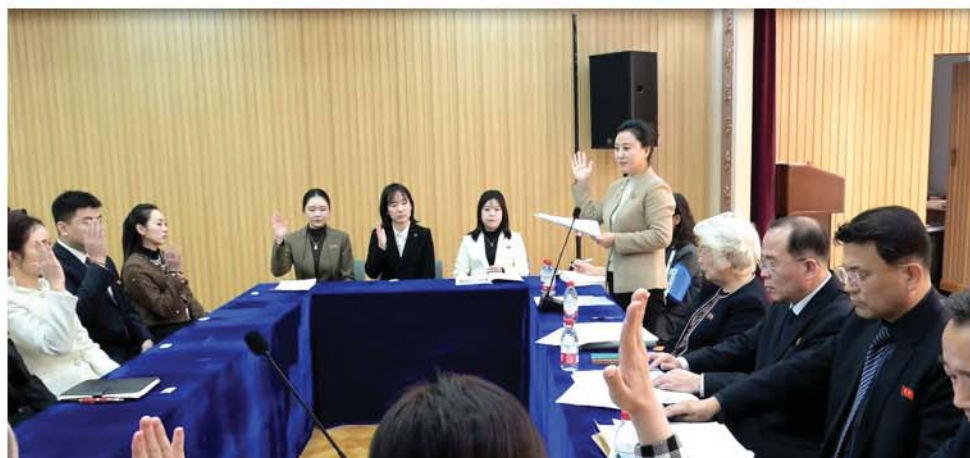
6-я сессия Общества корейской молодежи в Китае.