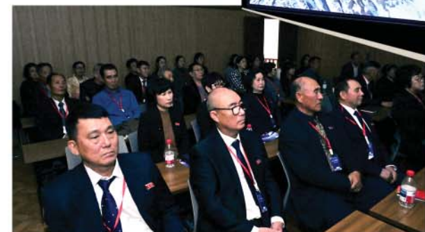
Идет демонстрация корейского документального фильма.