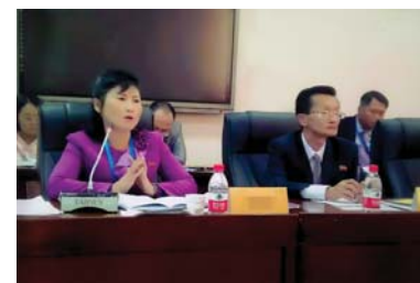
В 2018 году выступает с научной статьей на международной научной конференции, проходившей в Яньбяньском университете в Китае.