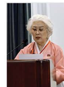
Председатель Чвэ Ын Бок.