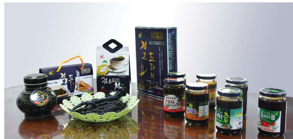
Продукты из «черных» колокольчиков.

В общем, колокольчик содержит много сапонинов, сахар, белок, жир, витамины и калий. Исстари наш