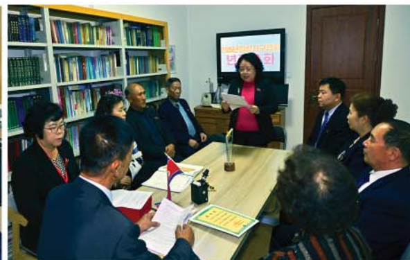
Совещание в регионе Гирин.