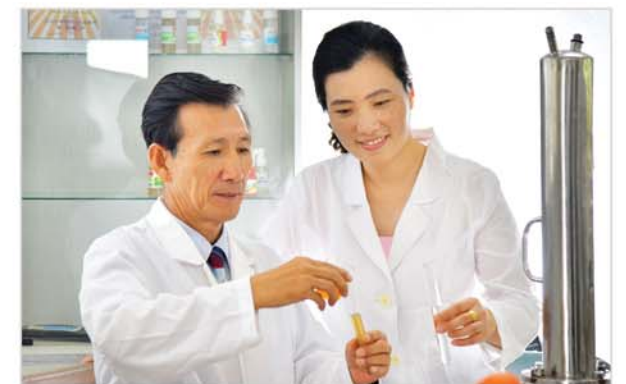
Прилагают большие усилия к разработке новых изделий.

Достижения агентства привлекают к себе большое внимание внутри и вне страны, и активизируются технический обмен и сотрудничество.