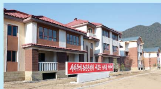
Везде строится много новых жилых домов для крестьян.