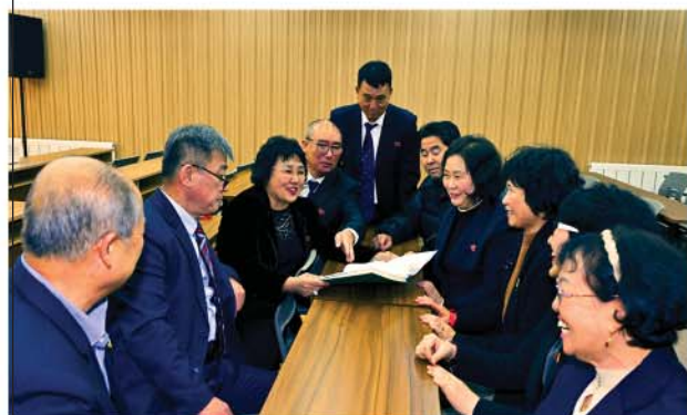
Совещание в регионе Ляонин.