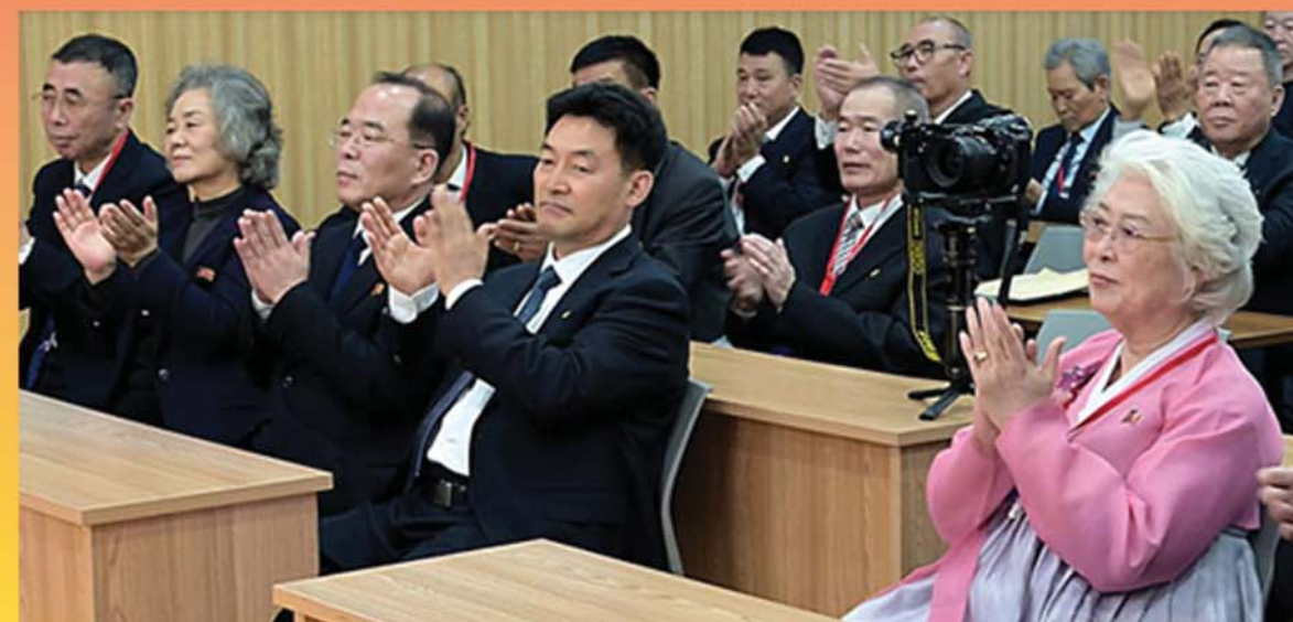
Поздравительный концерт после мероприятий.

ская идеология уважаемого товарища Ким Чен Ына о движении зарубежных соотечественников освещает им путь вперед и есть неиссякаемая сила всех корейских граждан в Китае, которые, сплотившись вокруг Республики, уверенно идут по пути патриотизма и любви к нации.