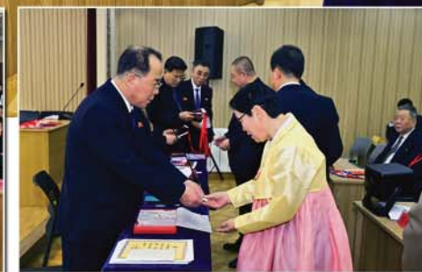
На заседании было зачитано письмо уважаемому товарищу Ким Чен Ыну, вручены похвальная грамота и благодарность с подарками.

важным моментом для укрепления и развития Ассоциации как организации зарубежных соотечественников, преданной уважаемому Ким Чен Ыну.