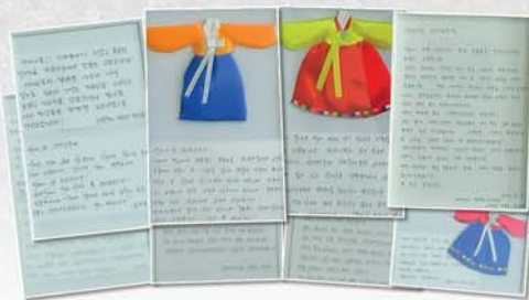
Благодарные письма, присланные выпускниками Корейского университета при Чхонрёне, посетившими Родину.

Студенты выпускного курса Корейского университета при Чхонрёне, посетившие историческую Родину в 2024 году, в своих письмах написали: