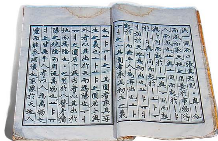
Корейский алфавит «Хунмин чонъым» создан в 1444 году.