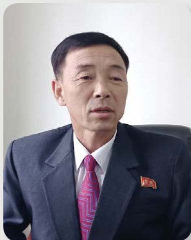
Кан Ги Чхор: Начальник управления Министерства металлургической промышленности.